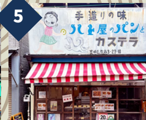
コッペパン 専門店ハト屋