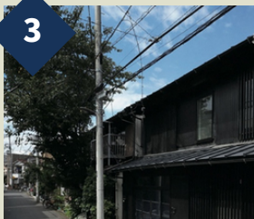
アカデミック ハウス京島1丁目