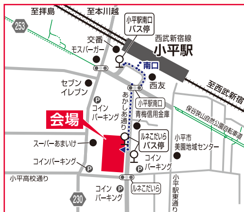
駐車場がありませんので、公共交通機関をご利用ください。

2023年 8/5 土 13:30~16:00 [開場 13:10~] 無料 ① セミナー: 予約不要(当日先着順60名) ② 個別無料相談会: 事前予約制(12組)